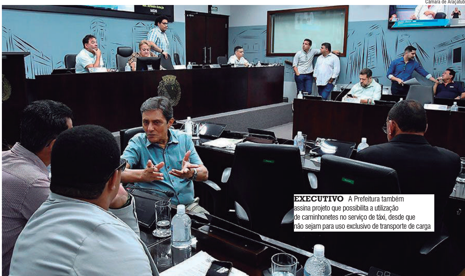
EXECUTIVO A Prefeitura também assina projeto que possibilita a utilização de caminhonetes no serviço de táxi, desde que não sejam para uso exclusivo de transporte de carga