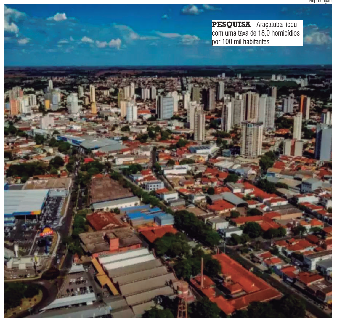
PESQUISA Araçatuba ficou com uma taxa de 18,0 homicídios por 100 mil habitantes

Os dados são baseados no número de assassinatos e incluem os "homicídios ocultos" registradas nas bases de dados do Ministério da Saúde.