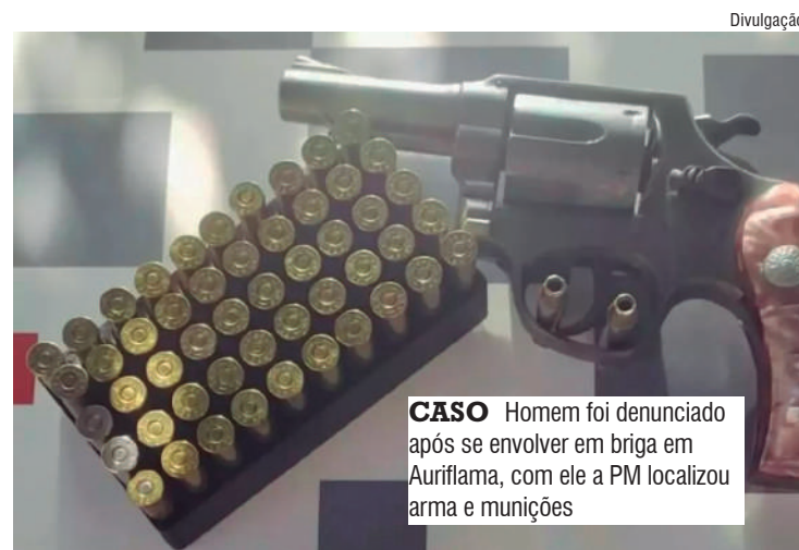
CASO Homem foi denunciado após se envolver em briga em Auriflâma, com ele a PM localizou arma e munições

Uma equipe da Polícia Militar se deslocou até o local indicado e abordou um indivíduo cujas características coincidiam