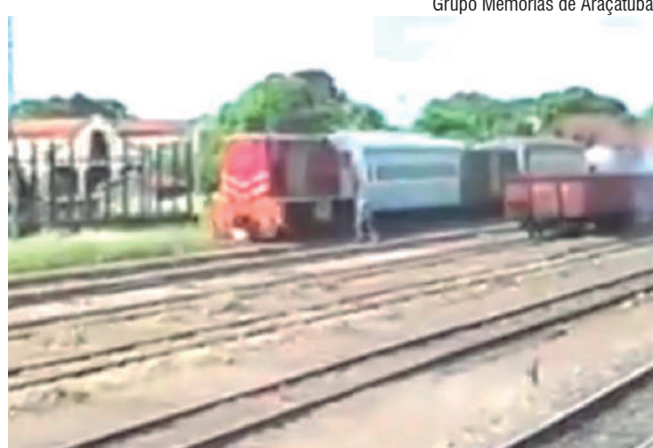
Estação ferroviária em 1994